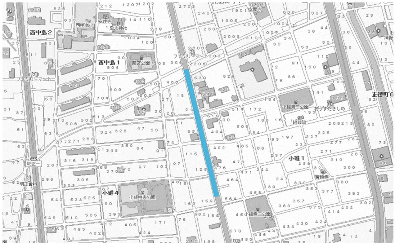
H27・H28 名古屋市都市計画基本図を使用

断面図 (工程については雨天により変更する場合があります) ※バスは通常運行です。