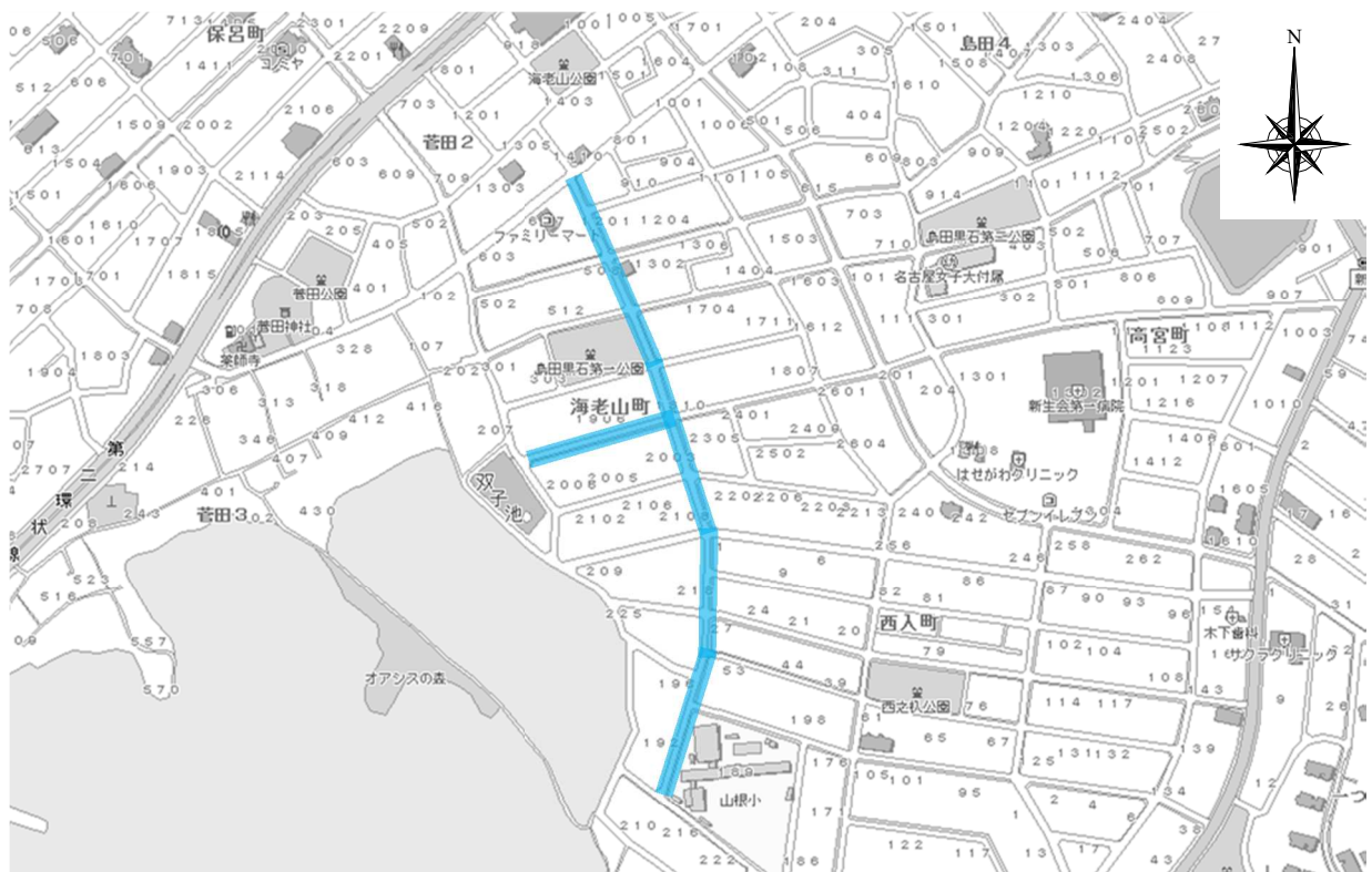
R2・R3 名古屋市都市計画基本図を使用